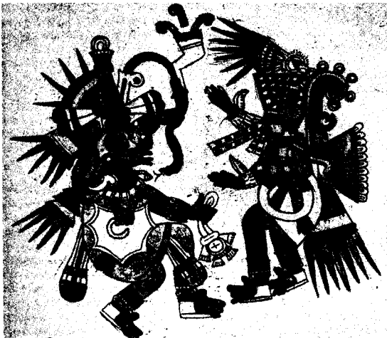
Obr. 1 Quetzalkoatl a Tezkatlipok

Všichni, kdo měli to štěstí a dostalo se jim takového hlubinného vhledu do kosmické tvůrčí laboratoře, by jistě souhlasili s tvrzením, že stupeň skutečnosti, který zažili, nelze výstižně vyjádřit slovy. Jako by mohutný impuls nepředstavitelných rozměrů zodpovědný za stvoření světů jevů obsahoval nejen všechny zmíněné prvky, byť se jeví našemu běžnému citění a našemu prostému rozumu na první pohled sebevíc protichůdné a paradoxní, ale i řadu dalších prvků. Je zřejmé, že navzdory všem našim snahám o pochopení a popis stvoření zůstává podstata tvůrčího principu a procesu zahalena neproniknutelným tajemstvím.